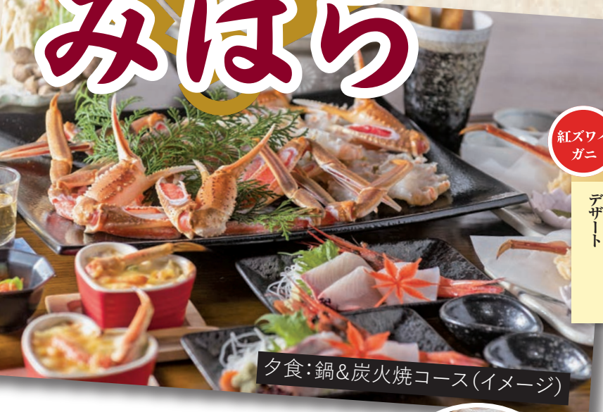
夕食：鍋&炭火焼コース(イメージ)