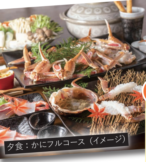
夕食：かにフルコース(イメージ)