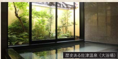
歴史ある佐津温泉(大浴場)