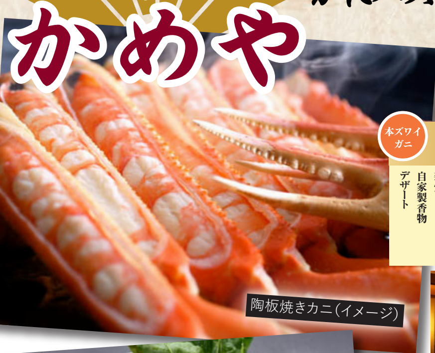
陶板焼きカニ(イメージ)