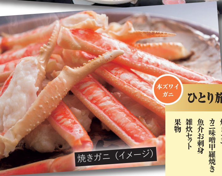
焼きガニ (イメージ)