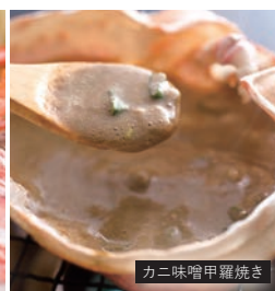
カニ味噌甲羅焼き