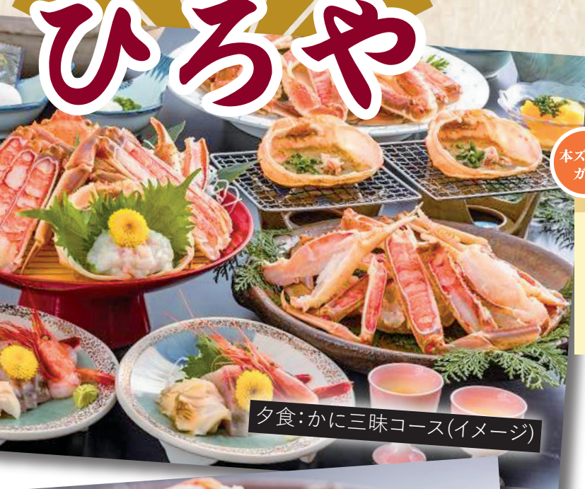
夕食：かに三昧コース(イメージ)