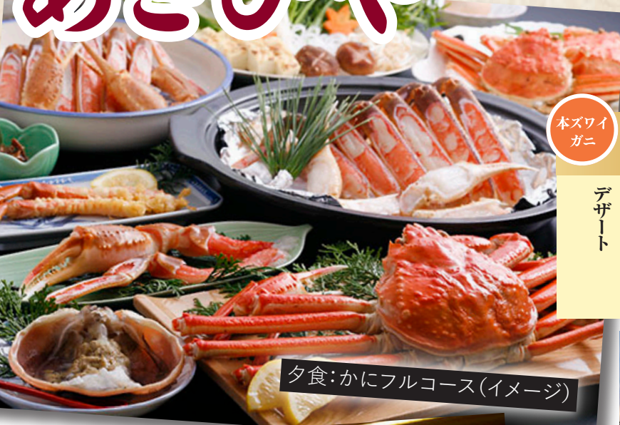
夕食：かにフルコース(イメージ)