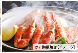
かに陶板焼き(イメージ)