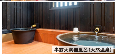
半露天陶器風呂 (天然温泉)