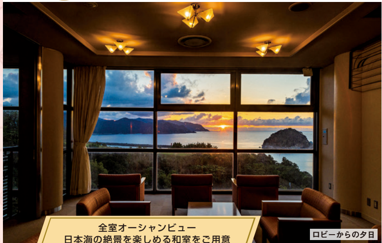
全室オーシャンビュー 日本海の絶景を楽しめる和室をご用意