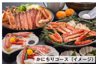
かにちりコース (イメージ)