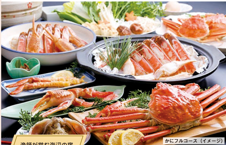
漁師が営む海辺の宿