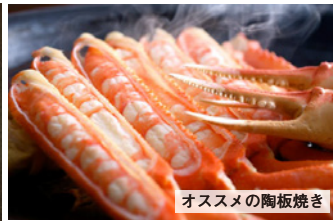
オススメの陶板焼き