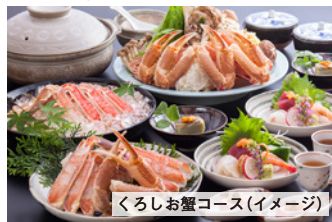
くらしお蟹コース (イメージ)