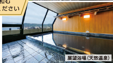
展望浴場(天然温泉)