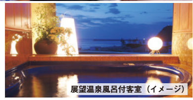
展望温泉風呂付客室 (イメージ)