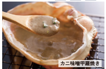
カニ味噌甲羅焼き