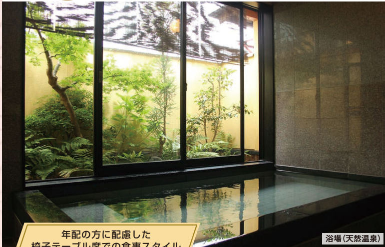
年配の方に配慮した 椅子テーブル席での食事スタイル