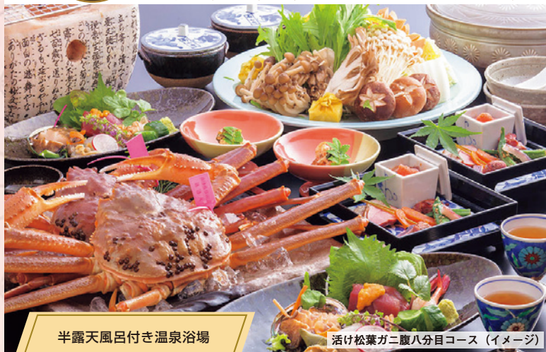
半露天風呂付き温泉浴場