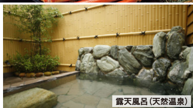
露天風呂 (天然温泉)