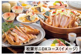
松葉ガニDXコース(イメージ)