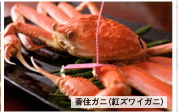
香住ガニ(紅ズワイガニ)