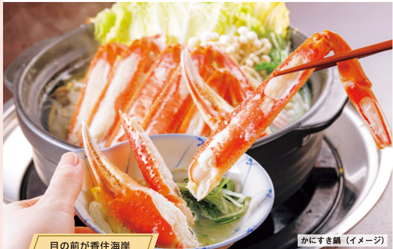
かにすき鍋 (イメージ)